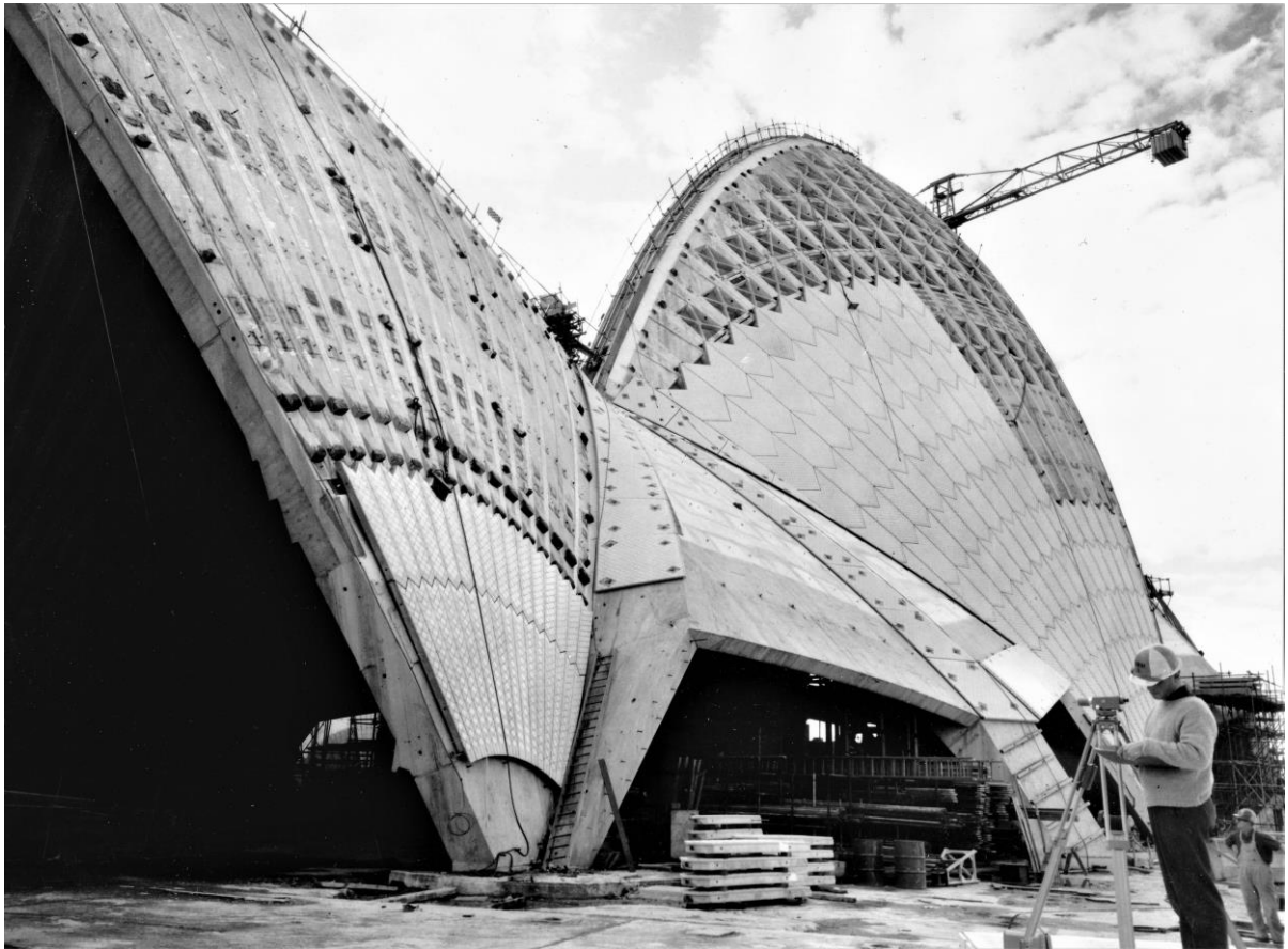
Abb. 4: Wild-Nivelliergerät NA2 im Einsatz beim Bau des Opernhauses Sidney (Eröffnung am 20. Oktober 1973 durch Königin Elisabeth II.).