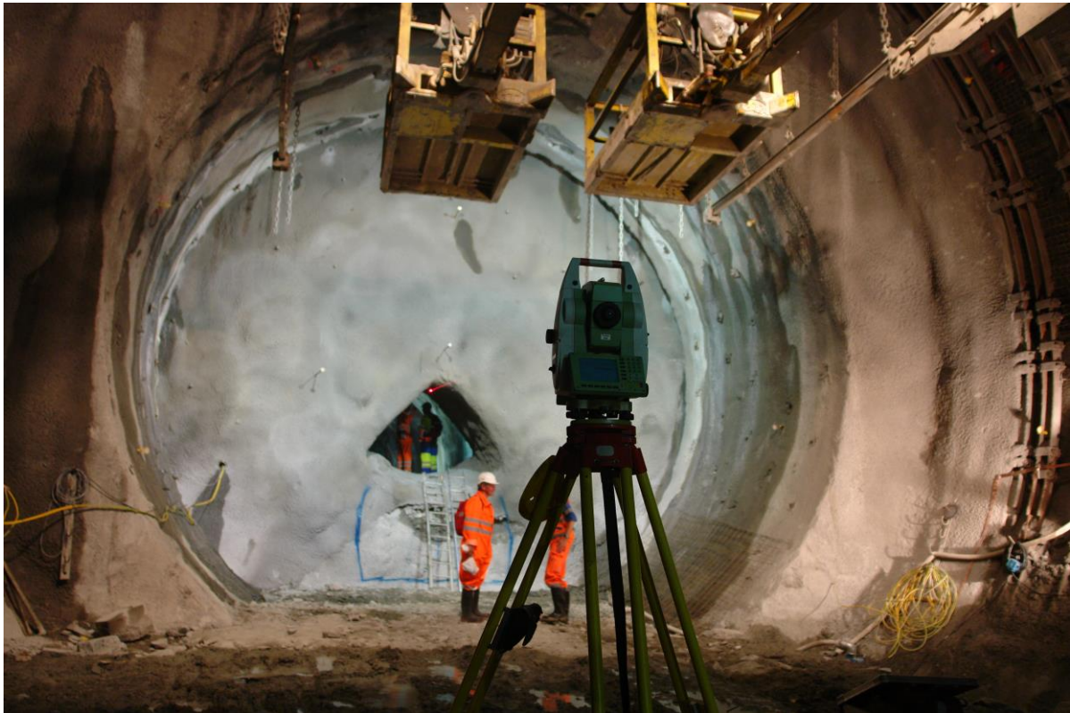
Abb. 6: Bei Bau und Überwachung des Gotthard-Basistunnels der NEAT, mit 57km längster Eisenbahntunnel der Welt, kommen verschiedene Leica Geosystems-Instrumente zum Einsatz, z. B. Totalstationen, GPS-Systeme und Digitalnivelliere. Die Abweichung auf die gesamte Distanz betrug nur wenige Zentimeter.