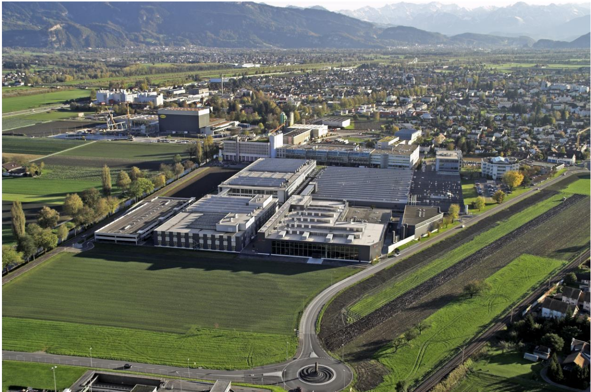
Abb. 8: Das SFS-Firmengelände Rosenbergsau in Heerbrugg, 2006.