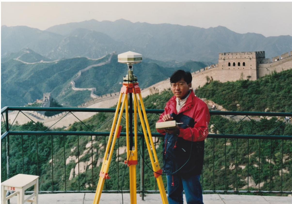
Abb. 5: Wild-GPS-System 200 bei einer Demonstration vor der Grossen Mauer in China.