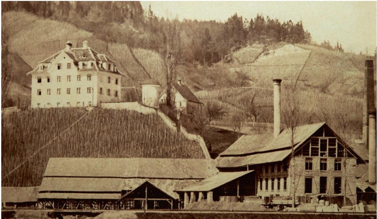
Abb. 2: Schloss Heerbrugg mit der von Karl Völker errichteten und von Jacob Schmidheiny ausgebauten Ziegelei um 1880. Älteste bekannte Foto von Fabrik und Schloss.