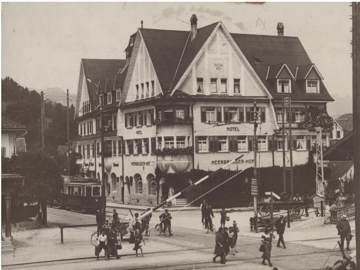
Abb. 3: Blühender Verkehrsknotenpunkt: Eisenbahnlinie und Strassentram am Bahnhof Heerbrugg, 1911.